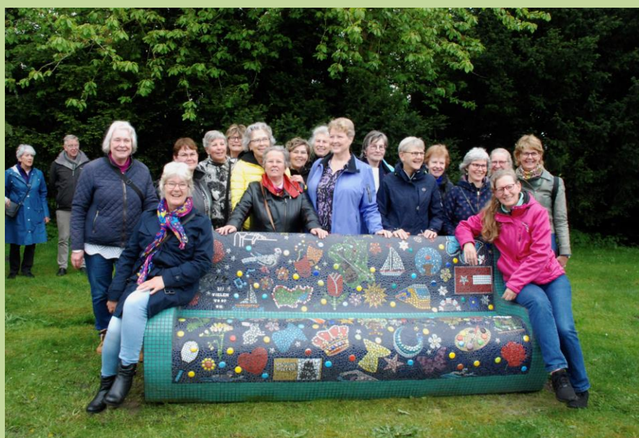
De bank in 2023

Bij de prijsuitreiking hebben wij verantwoording afgelegd van de besteding van het geld. Dat hebben we voor het realiseren van de mozaïekbank gebruikt. Het is een mooi verhaal om te vertellen: over samenwerking, plaats voor herinneringen en een passend kunstwerk. We hebben iedereen uitgenodigd om Hoorn te bezoeken en plaats te nemen op de bank.