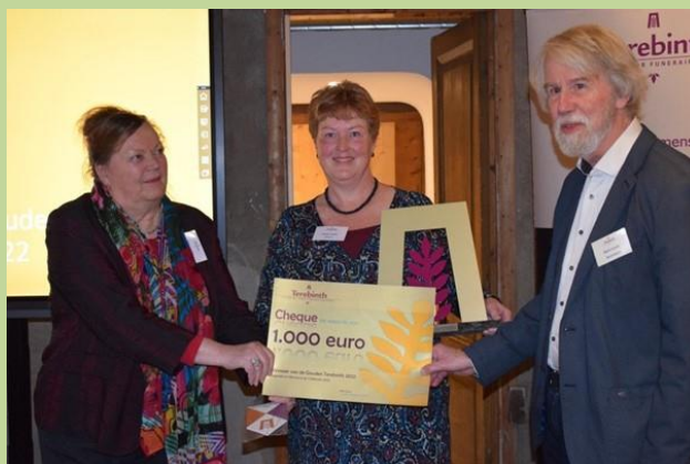
De cheque in 2022

In 2022 won de stichting Vrienden van de begraafplaats Keern tot haar grote verrassing de Gouden Terebinth, een landelijke prijs voor een bijzondere begraafplaats.