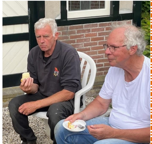
Een welverdiende pauze, 25 mei 2022